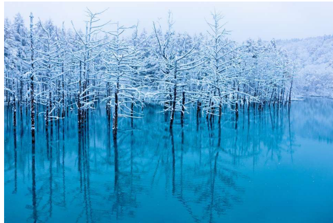
Shirogane Blue Pond

Menuju Biei untuk mengunjungi Shirogane Blue Pond , danau dengan air berwarna biru unik. Terkenal karena airnya yang memiliki warna biru muda yang sangat khas. Warna ini bukan berasal dari warna langit yang terpantul di permukaan air, melainkan dari partikel-partikel mineral yang terlarut di dalamnya. Kandungan partikel-partikel mineral seperti aluminium hydroxide yang terlarut dalam air menciptakan efek Tyndall . Efek ini membuat cahaya matahari yang masuk ke dalam air menjadi tersebar dan terpantul, memberikan tampilan biru yang memukau. Saat musim dingin, Shirogane Blue Pond menjadi lebih dramatis dengan salju yang meliputi sekitarnya. Warna biru yang kontras dengan salju putih menciptakan pemandangan yang menakjubkan.