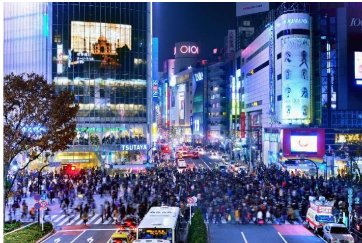
Shibuya Scramble Crossing

Selanjutnya, perjalanan dilanjutkan ke Shibuya, salah satu distrik paling ikonik di Tokyo. Disini terdapat Shibuya Crossing , yang merupakan persimpangan pejalan kaki terpadat di dunia dan juga patung Hachiko si anjing setia yang terkenal. Jelajahi juga pusat perbelanjaan, kafe, dan hiburan di sekitar Shibuya sebelum mengakhiri hari dengan kembali ke hotel.