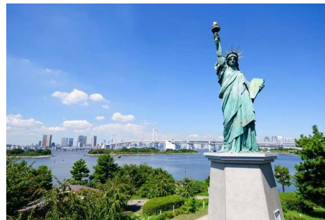
Odaiba Seaside Park