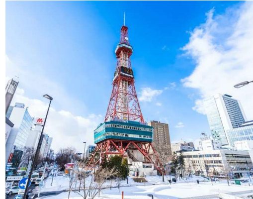
Sapporo TV Tower