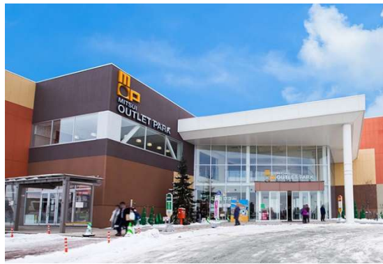
Mitsui Outlet Park Sapporo Kitahiroshima

Tiba di Bandara New Chitose dan melanjutkan perjalanan menuju Sapporo. Perjalanan akan dimulai dengan mengunjungi Mitsui Outlet Park Sapporo-Kitahiroshima , sebuah destinasi belanja terkenal dengan lebih dari 150 toko dengan merek-merek terkenal lokal Jepang dan Internasional. Disini dapat menemukan pakaian, sepatu, peralatan olahraga, barang elektronik, dan banyak lagi produk lainnya yang harganya lebih murah dibandingkan dengan di Indonesia. Dirancang dengan konsep outlet, Mitsui Outlet Park Sapporo-Kitahiroshima menawarkan pusat belanja dengan arsitektur modern dan desain yang menarik.