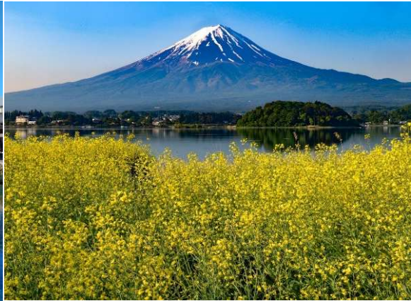
Pemandangan dari Oishi Park