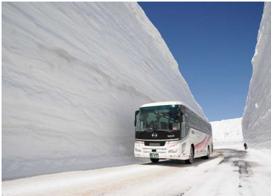
Dinding Es di Murodo