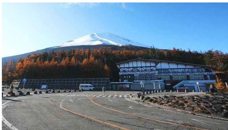
Fuji Subaru 5 th station

Perjalanan akan dimulai menuju Gunung Fuji untuk mengunjungi Fuji Subaru 5 th Station . Fuji Subaru 5 th station merupakan titik awal pendakian Gunung Fuji yang terdekat dengan puncak Gunung Fuji . Fuji Subaru 5 th station memiliki fasilitas seperti toko souvenir dan restoran, juga menawarkan pemandangan indah dari dekat puncak gunung fuji .