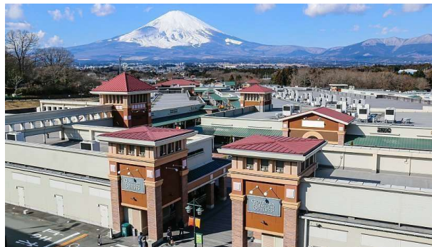
Gotemba Premium Outlet

Peserta akan diantar untuk mengunjungi Gotemba Premium Outlet untuk pengalaman belanja yang eksklusif dengan latar Gunung Fuji . Gotemba Premium Outlet merupakan destinasi belanja terkenal dengan lebih dari 200 toko yang menawarkan merek-merek terkemuka yang harganya lebih murah dibandingkan dengan di Indonesia. Setelah puas berbelanja, perjalanan akan dilanjutkan ke hotel di kota Matsumoto untuk bersiap menjelajahi Alpine Route di hari berikutnya.