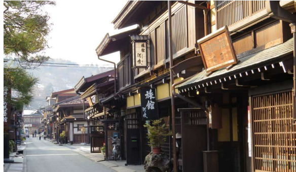
Takayama Old Town