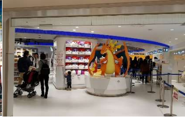
Pokemon Center Ikebukuro