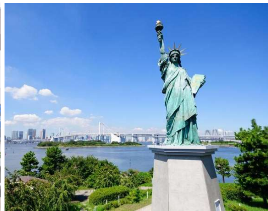
Odaiba Seaside Park